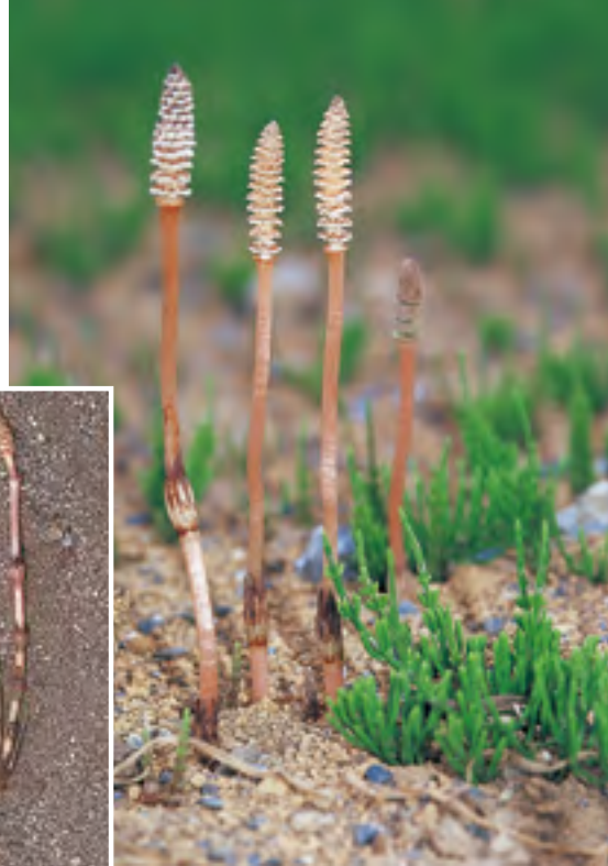
孢子茎と栄養茎は地下でつながる。ツクシのはかまというのはさや状の葉のこと [5月、長野]

多年生のシダ植物。荒れ地、造成地、土手の斜面などに生育。地下茎が長くはい、その節々から芽を出して増える。ときどき大群生する。春、早く出るツクシ(土筆)はスギナの孢子茎で、この頭(孢子囊穂)には多数の孢子囊がつき孢子が散る。和名は杉菜の意味。