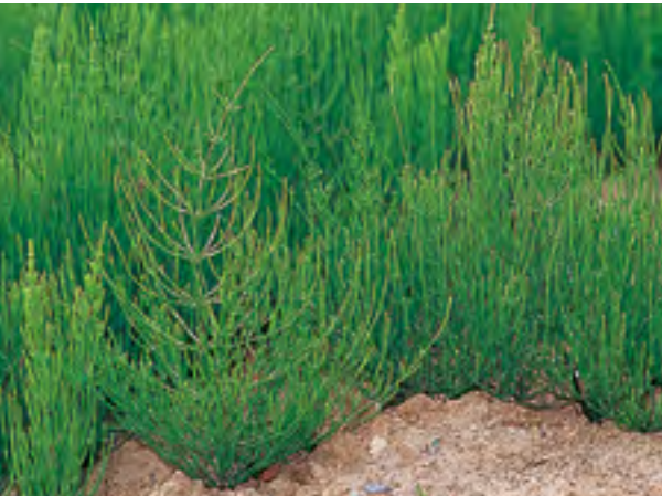
空き地に群生するスギナの栄養茎