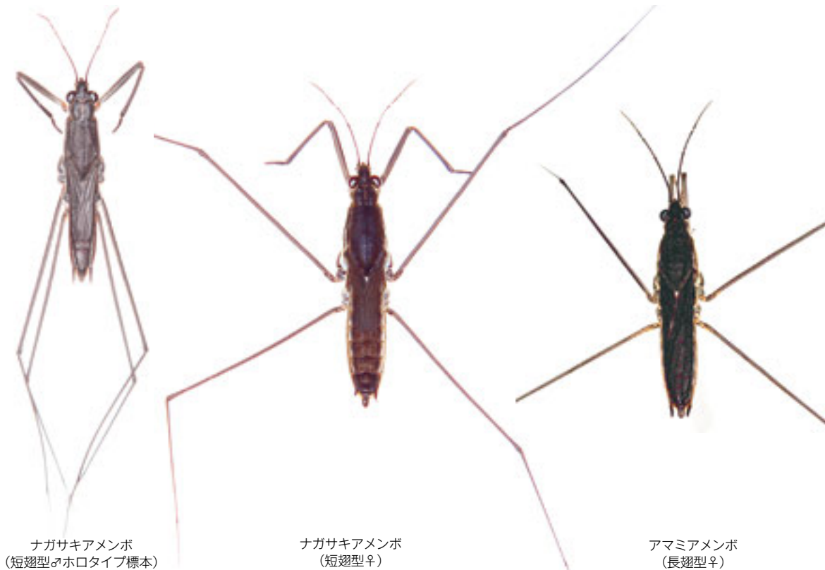
ナガサキアメンボ (短翅型♂ホロタイプ標本)

■アメンボ亜科の各種は、サイズ、触角や脚の節長、前胸背の色や紋、腹部の形状などによって見分けられる