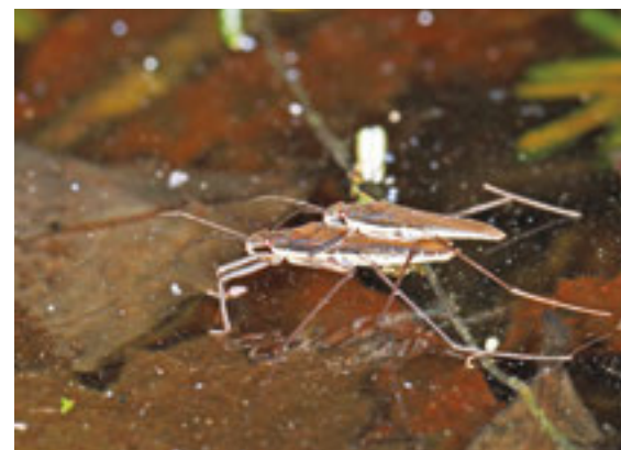
コセアカアメンボ