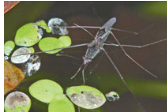
ツヤセアジアメンボ