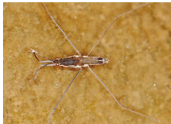
ナミアメンボ(短翅型)