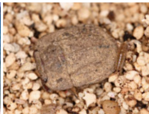
浜辺のアシプトメイズムシ 九州南部以南の海岸の浜辺や落ち葉下におり、ダンゴムシなどを捕食する。前脚は捕獲用に発達している