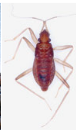
礫の下に住むウミズカメムシ 海岸の礫を掘ると見つかリ、水面に見られる他のミズカメムシ類とは生活環境が大きく異なる