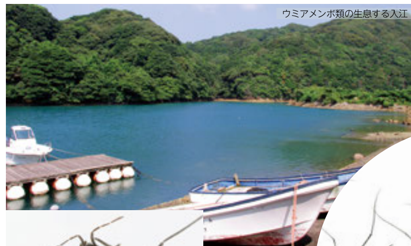
ウミアメンボ ウミアメンボ亜科に属し、ケシウミアメンボより活動範囲は広い。波の穏やかな内湾に生息する