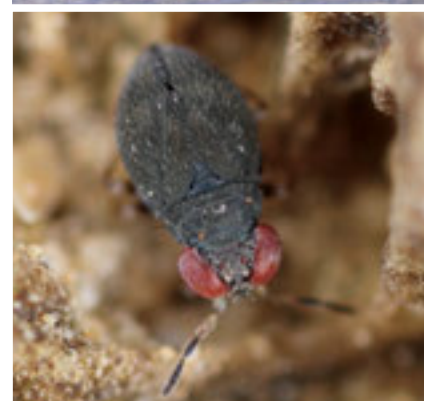
サンゴカメムシ 甲虫のような翅をした微小種で、一般のカメムシのような膜質部がない