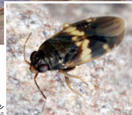
サンゴミズギワカメムシ 南西諸島の磯に生息する